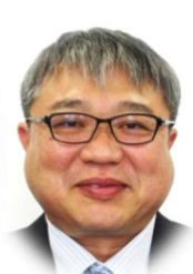
西川 祐司 愛知県スポーツ局