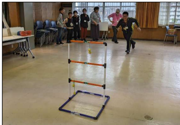
ラダーゲッター（ニュースポーツ部）