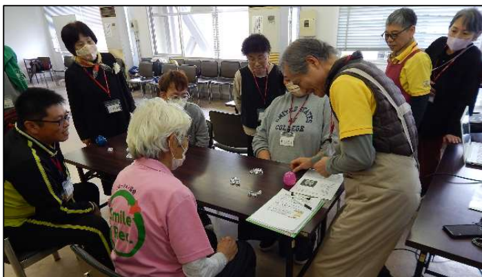
お名前ビンゴ&タッチペンじゃんけん&ゲーム机体操(指導者支援部)