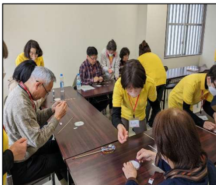
テーブルレク&クラフト（指導者育成部）