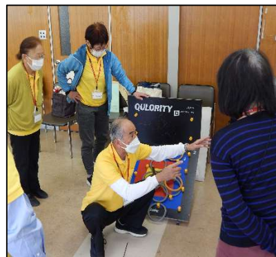
クオリティー（イベント支援部）