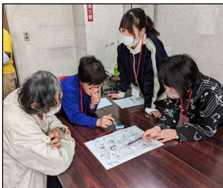
グループワークトレーニング（総務部）

午後からのレクリエーション指導者大会では、「レクリエーションラリー」を楽しみました。レクリエーションラリーとは、5つの部会がそれぞれのテーマでレクリエーションの体験コーナーを設定し、参加者が順に体験するというものです。参加者はそれぞれの場所で楽しそうに取り組み、充実した時間を過ごしました。