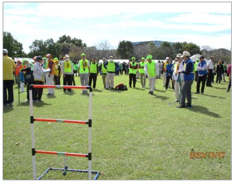
【老人スポーツ大会ラダーゲッター】