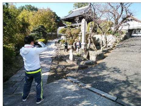
【安城城フォトウォークラリー】