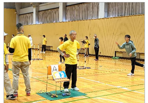
【愛知県ラダーゲッター選手権大会】