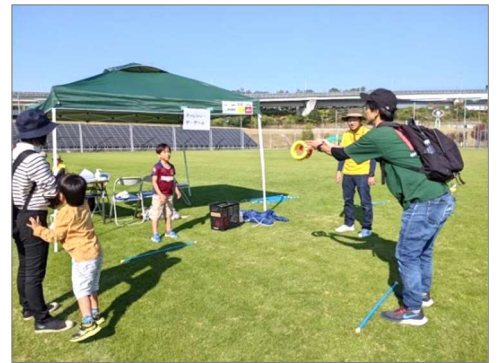
【スポレク EXPO あいち 2023】