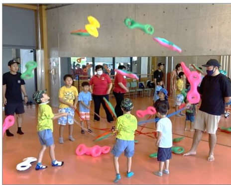
【ニュースポーツフェスティバル】