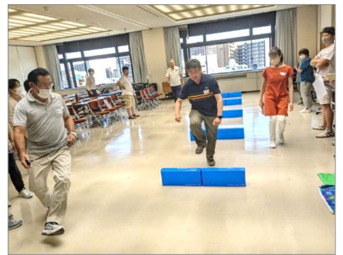
【レク実技スキルアップセミナー】