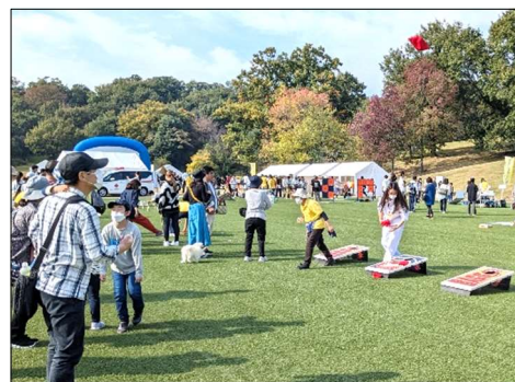
【勤労者スポーツフェスティバル】