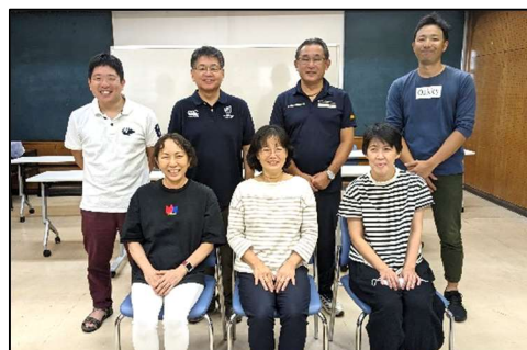
【インストラクター講習を終えた皆さん】