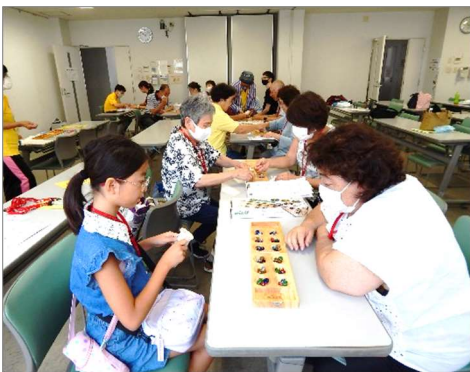
【マンカラ交流大会】