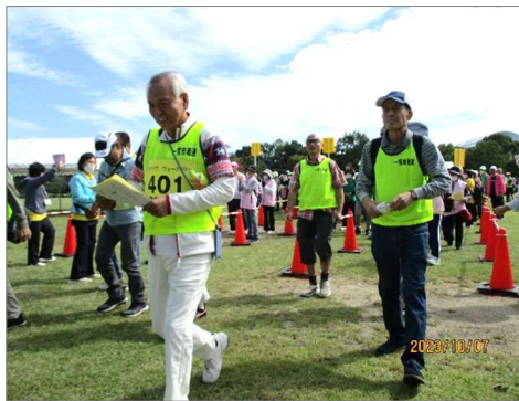
【老人スポーツ大会ウォークラリー】