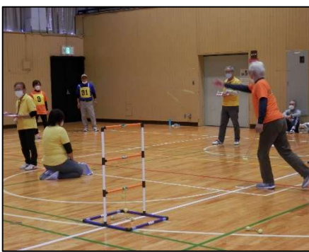
【愛知県ラダーゲッター選手権大会】