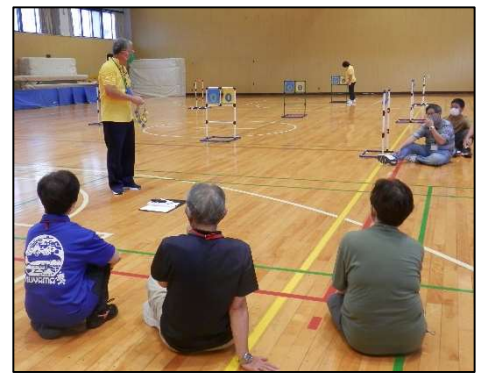
【ラダーゲッター普及員養成講習会】