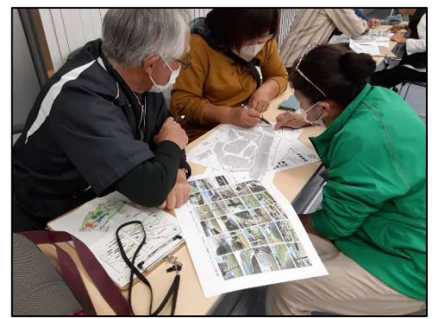
【レクリエーション指導者クラブ交流会】