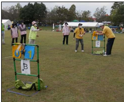
【老人スポーツ大会ラダーゲッター】