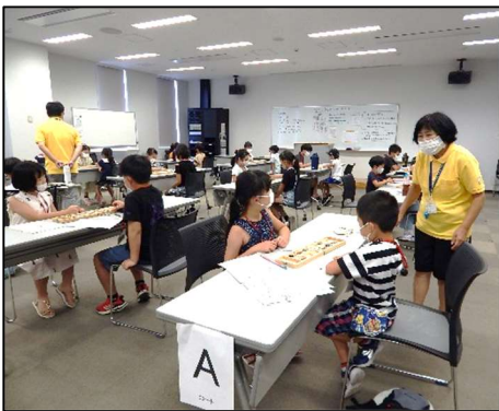
【マンカラ交流大会】