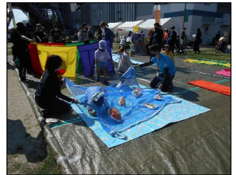
【なごやNPO 応援フェスタ】