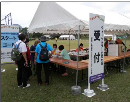
【老人スポーツ大会ウォークラリー】