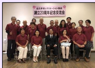
長久手市 レクリエーション協会 様