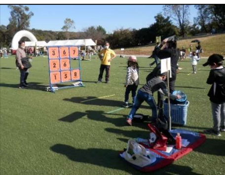
【勤労者スポーツ大会】