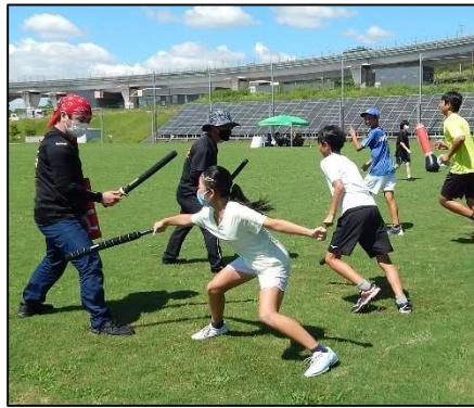
【ニュースポーツフェスティバル】