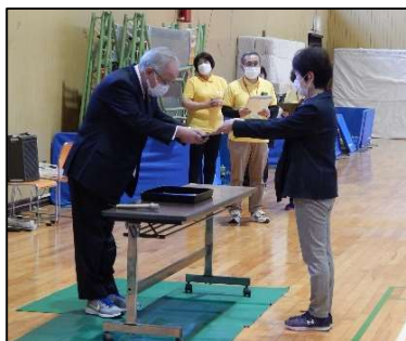
【会長による 資格証伝達】

令和3年度のレクリエーション指導者大会は、令和4年3月21日に愛知県体育館で行われました。新型コロナウイルス感染拡大防止のため、残念ながら午後から予定していたグループワーク・トレーニングを中止にしたこともあり、参加者数は若干少なくなり、50名近くの参加となりました。今回は、レクリエーション・インストラクターに加え、スポーツレクリエーション指導者の新資格証伝達も行いました。協会が4月1日より、特定非営利活動法人になるため、経緯と定款の説明を行いました。協会は新たなスタートとなります。レクリエーション指導者の会議なので、途中にアイスブレイキングゲーム、最後にグループワーク的な振り返りを入れ、短時間ながら充実した時間となりました。