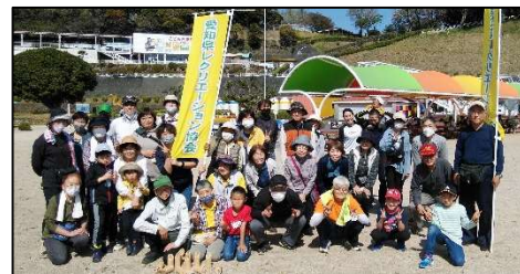
【これだけ多くの方の参加でした】