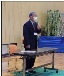
【理事長による 法人化説明】