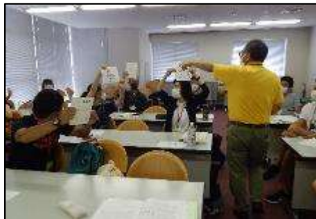
教員免許更新講習会