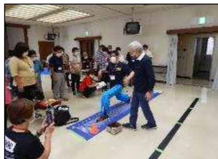
レク式体力チェック