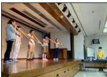
介護レク！スキルアップセミナー