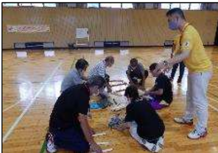
ラダーゲッター元気アップ教室