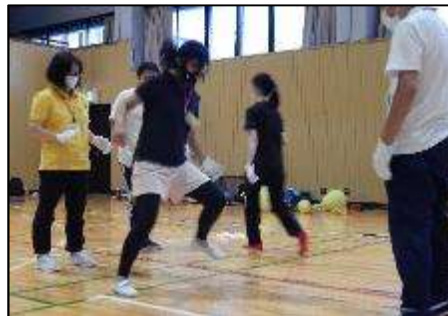
チャレンジ・ザ・ゲーム