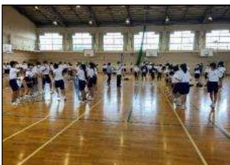
「心の元気づくり」365プロジェクト