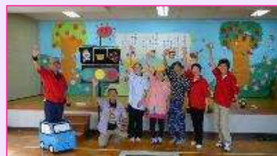
北名古屋市レクリエーション協会 様